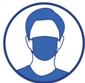
Port du masque obligatoire

Nous vous remercions de votre compréhension et vous souhaitons une agréable visite.