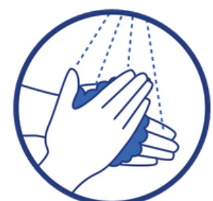
Solution hydro-alcoolique à disposition